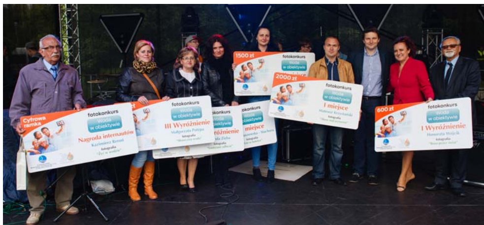
Nagrody wręczono autorom najlepszych fotografii zgłoszonych do Fotokonkursu „Woda w obiektywie” 31 maja br. podczas Dni Dąbrowy Górniczej

– W tym roku, co do wyboru zdobywcy I miejsca nie mieliśmy wątpliwości, widok fajerwerków nad jeziorem naprawdę robił wrażenie. Zwłaszcza, że poetyka tłumy ludzi z komórkami w dłoniach, którzy chcą uwiecznić piękne widowisko, to znak naszych czasów. Już nie ufamy własnej wrażliwości i pamięci, gdy widzimy coś interesującego sięgamy po telefon komórkowy, by to uwiecznić – wyjaśnia Marcin Liberski.